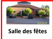
Salle des fêtes