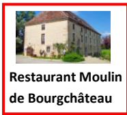
Restaurant Moulin de Bourghâteau